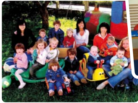
Kinderkrippe: Betreuung für die Kleinsten