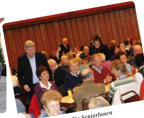
Veranstaltungen für SeniorInnen