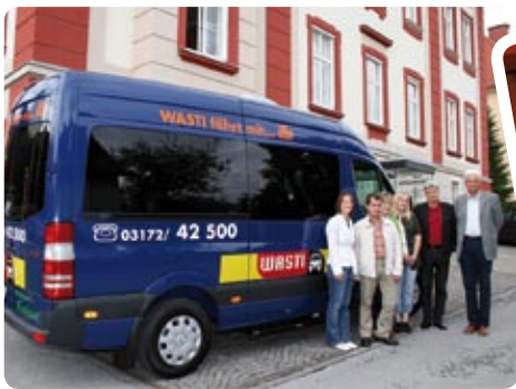
Unterwegs mit dem WASTI