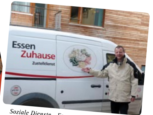
Soziale Dienste - Essen auf Rädern