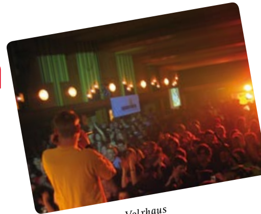
Jugendkonzerte im Volkshaus

„Heimat für alle Generationen“ lautet das klare Ziel für das gesellschaftliche Miteinander. In unserer Stadt sollen sich alle wohl fühlen, die Jugend genauso wie die SeniorInnen.