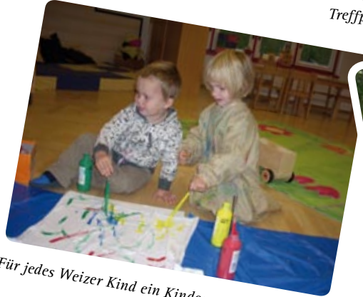
Für jedes Weizer Kind ein Kindergartenplatz