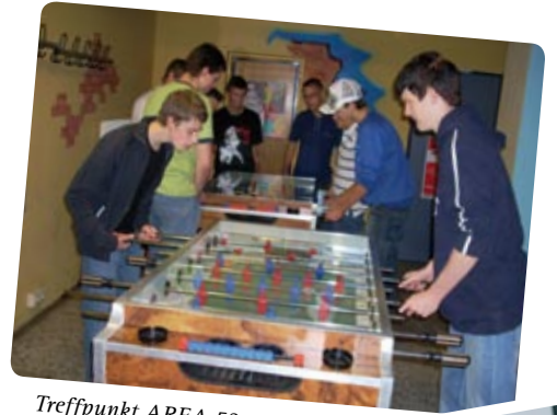
Treffpunkt AREA 52