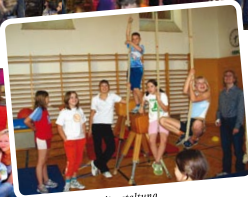
Sport als Freizeitgestaltung