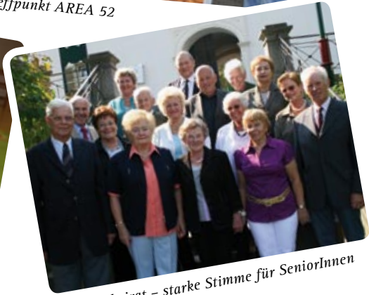
Seniorenbeirat – starke Stimme für SeniorInnen